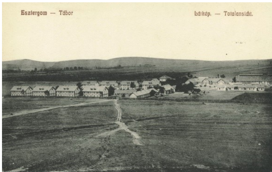
Látkép – képeslap kb 1915

1990 – raktár, dohánybolt, bővíttve – homlokzati átalakítás – tetőcsere