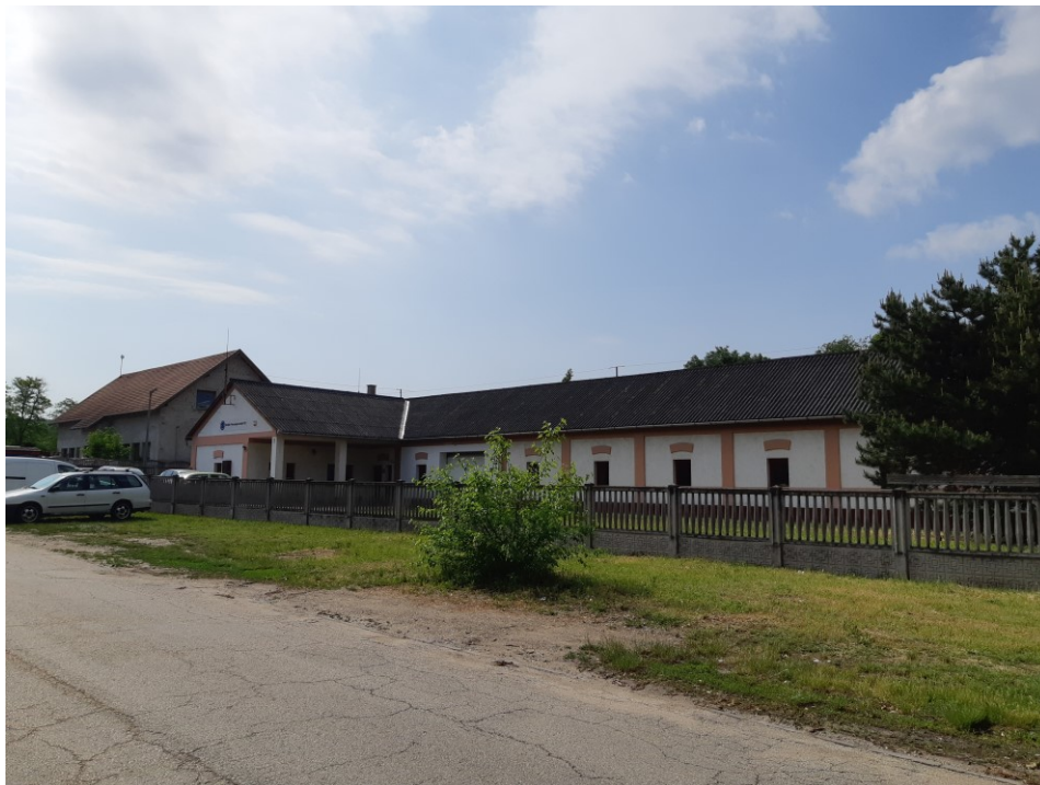
Ipari funkciók– saját fénykép 2023

1990 - ipari funkció, részben átépítve, bővítve – homlokzati átalakítás