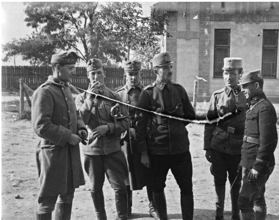
Fénykép kb 1912