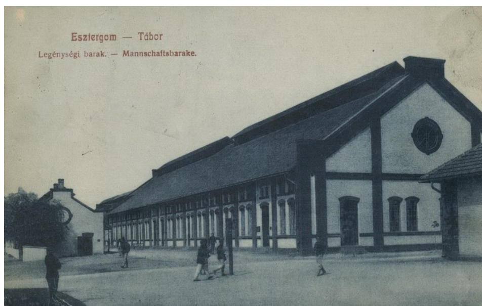
Barakk – képeslap 1912