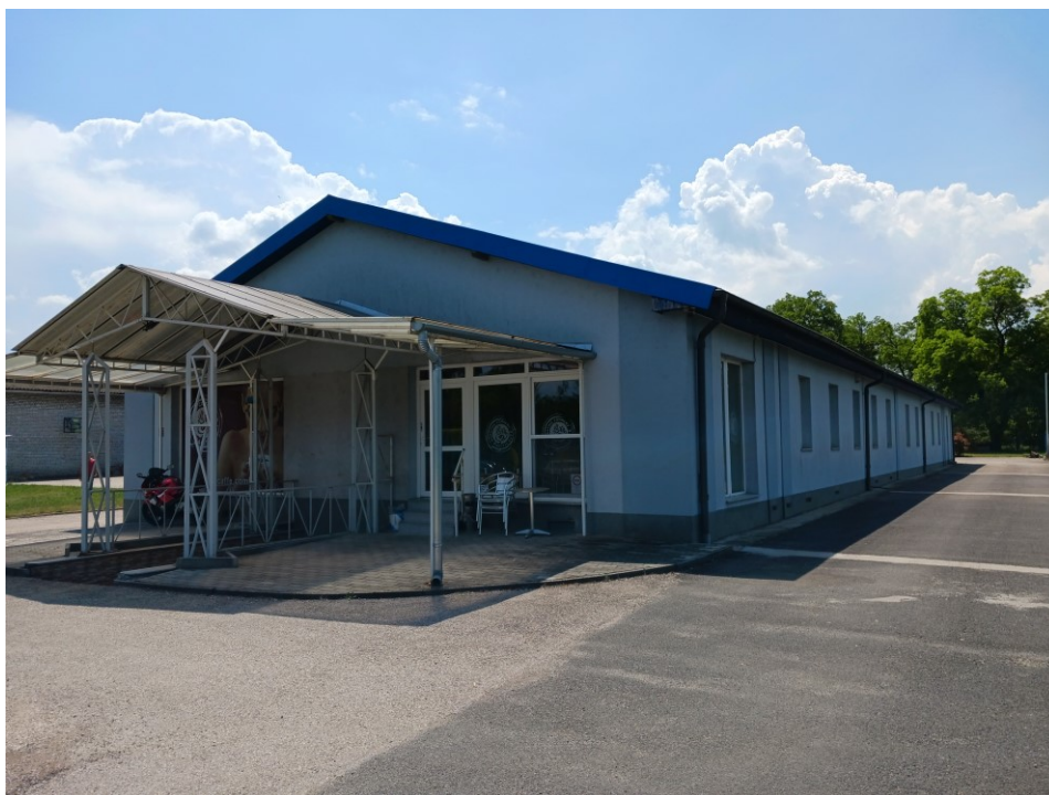
Ipari funkciók 2023