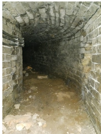
Alagutak, kamrák – saját fénykép 2023