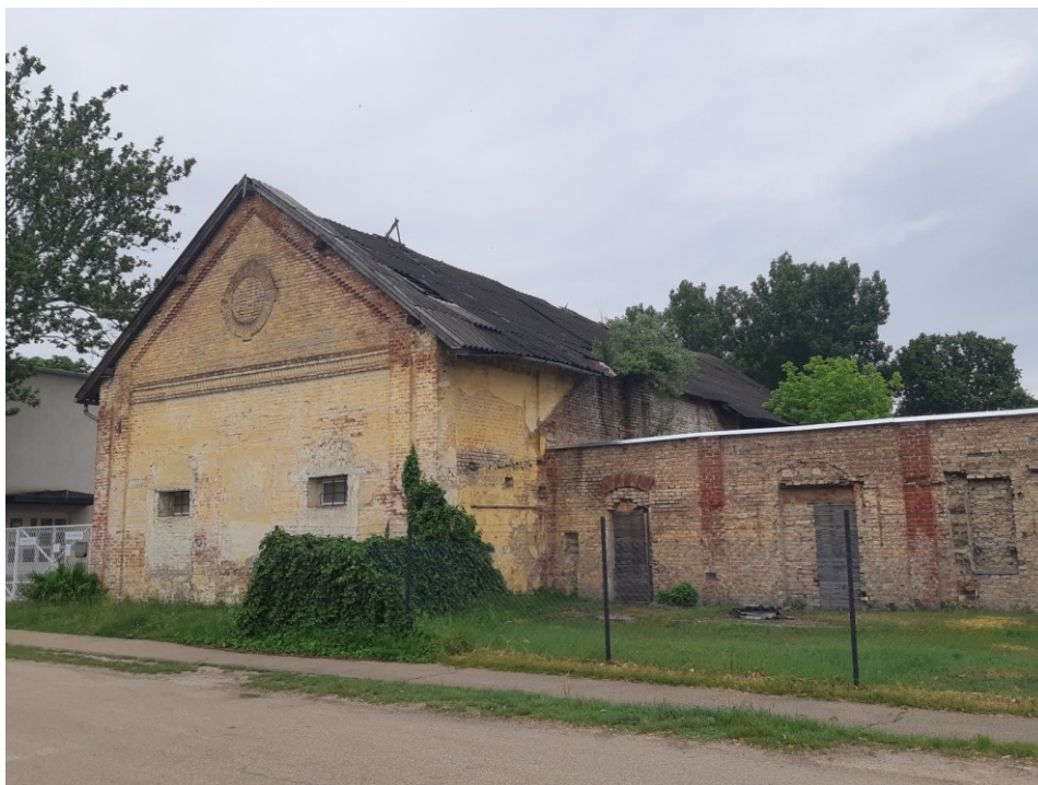
Ipari funkciók – saját fénykép 2022 azóta tetőfedés cseréje megtörtént

1990- több ipari, raktár funkció, több tulajdonos – tetőbontás a déli szárnyban, téglakülső köpenyezés, ablakcsere 2000 után