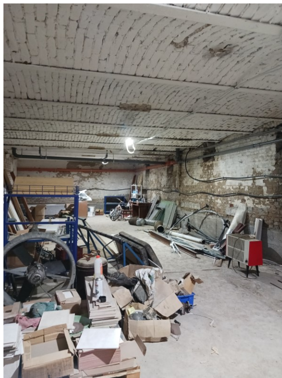
Pince több helyiség (kb 300 m 2 )– saját fénykép 2023