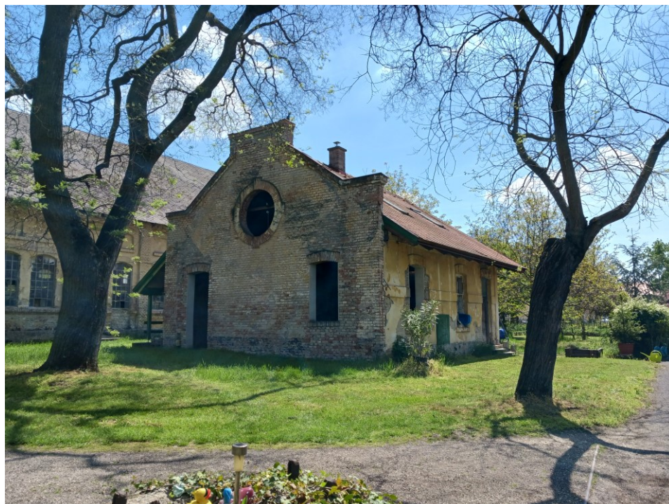
Raktár – saját fénykép 2023