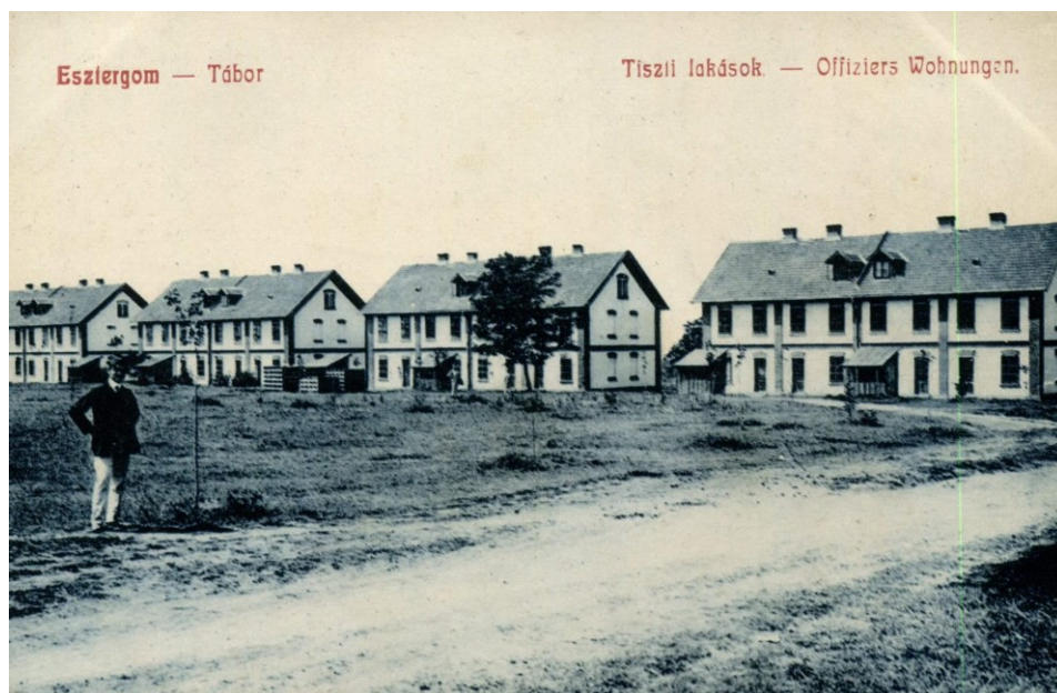
Lakóépületek– Képeslap kb 1915