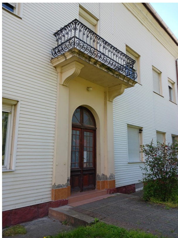
Lakóépület 2023