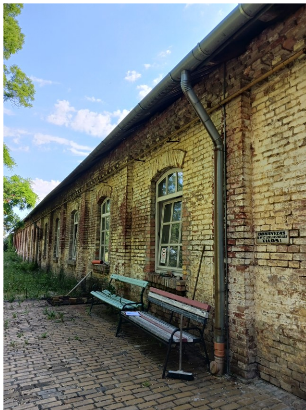
Üzem 2023

1990-Faipari üzem – kétszintessé építve, földemosztással