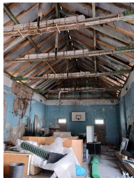
Raktár, új tetőfedés – saját fénykép 2023