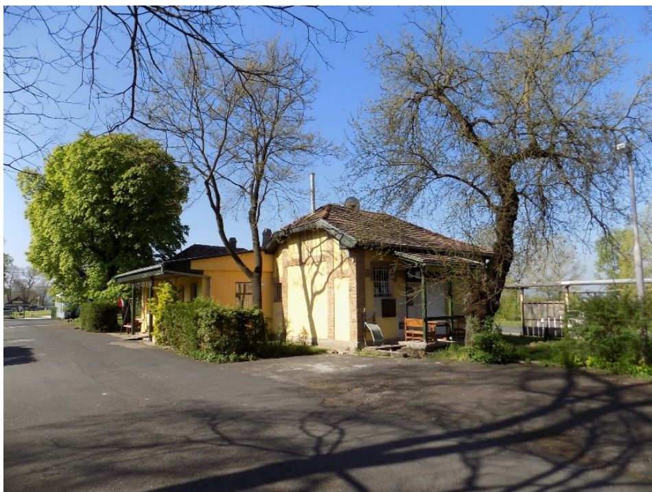
Iroda, lakás 2023