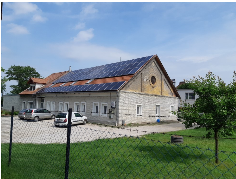
Ipari funkciók déli szárny– saját fénykép 2023