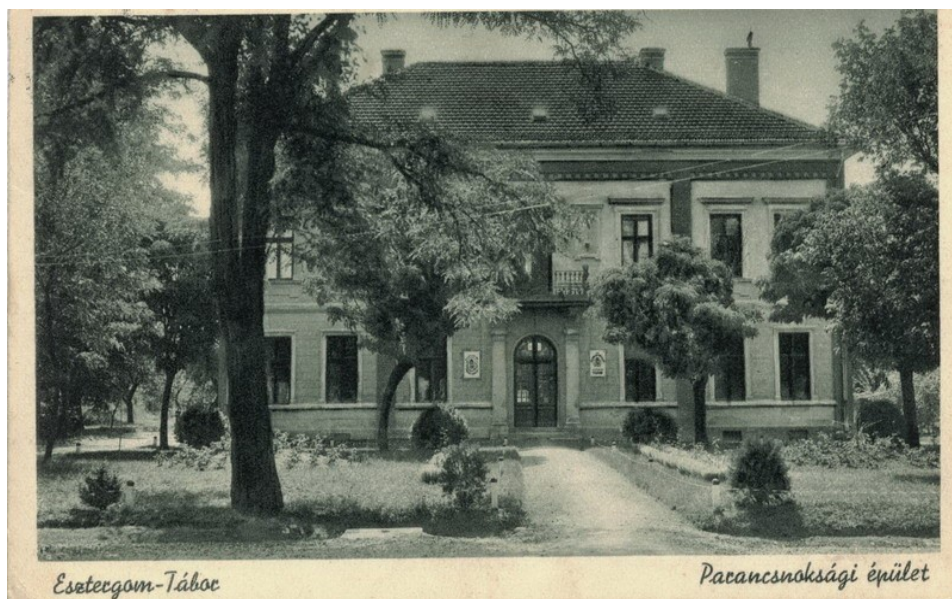
Parancsnoki épület – képeslap kb.: 1940